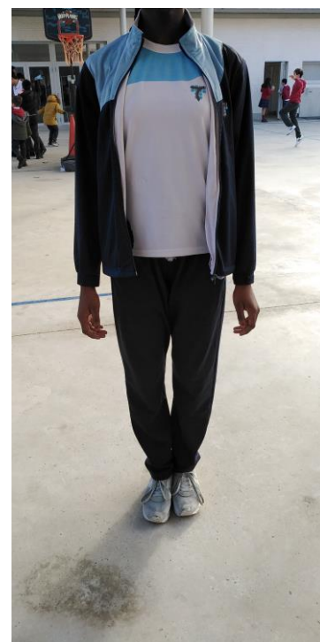
Telovadnica in šolska športna uniforma