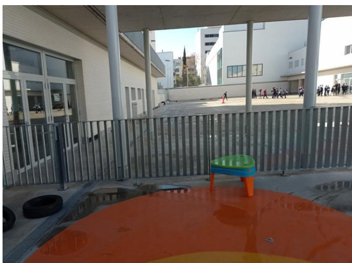
Zunanje šolsko igrišče