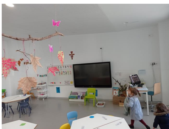
Ena od učilnic najmlajših učencev