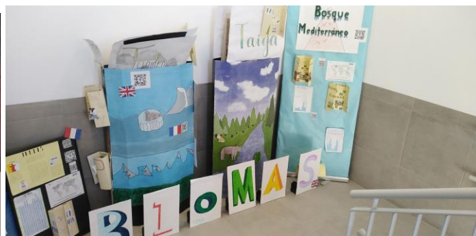
Projekti, ki so jih učenci izvajali tekom našega izobraževalnega obiska